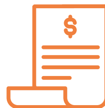
DOAÇÃO DE NOTA FISCAL PAULISTA