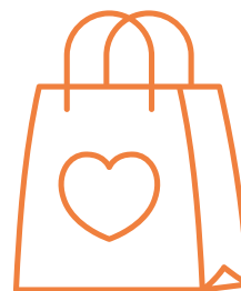
COMPRA NO ARMAZÉM