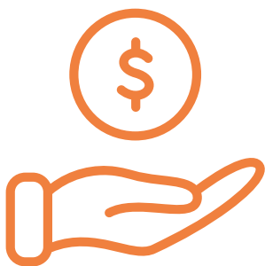
PATROCÍNIO DE PROJETOS